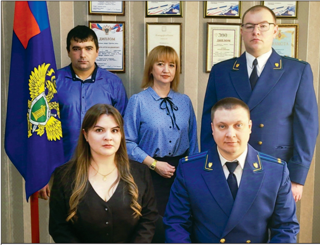
Коллектив Турковской прокуратуры

– В современном мире проблема дистанционного мошенничества стоит особенно остро. И жертвами становятся не только пожилые люди, но и молодые, образованные, с постоянной работой. Так в 2024 году были возбуждены уголовные дела о переводе денег на якобы биржу. Мошенникам удалось убедить потерпевшую установить приложение на телефон, через которое она должна была делать инвестиции. В результате деньги были потеряны. В одном из таких эпизодов было потеряно полмиллиона рублей. Мы принимаем меры по противодействию преступлениям, совершаемым с использованием современных информационных технологий, однако и гражданам не надо терять бдительности. Не доверяйте звонкам от лжесотрудников службы безопас-