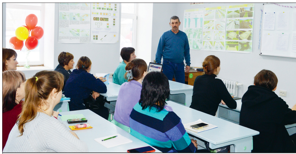
Теоретическое занятие в автошколе

После долгого перерыва в Турках открылась автошкола