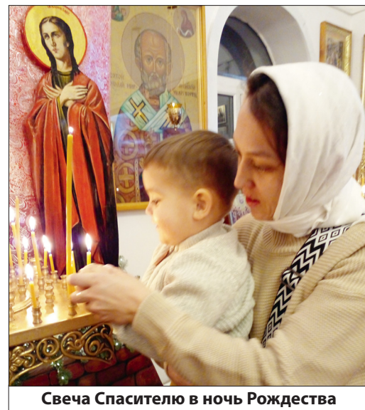
Свеча Спасителю в ночь Рождества