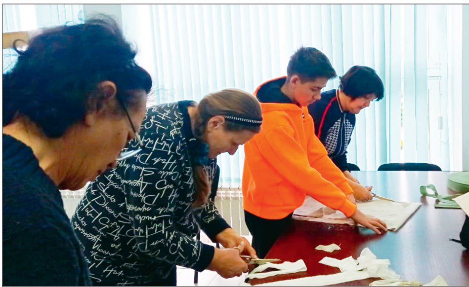
Волонтеры плетут маскировочные сети

Вспоминая самые важные моменты, достижения и вызовы года