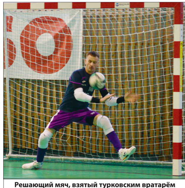
Решающий мяч, взятый турковским вратарём