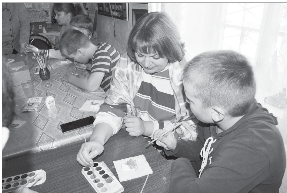
Рождественская мастерская: изготовление ёлочных игрушек

Удивительным было узнать о том, как праздновали Сочельник и Рождество в нашем родном поселке в XIX веке. Об этом рассказали воспоминания Веселовских и Кишкиных, которые сохранились в архивах нашего музея.