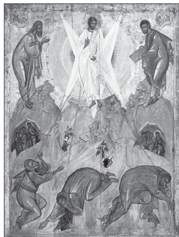
Феофан Грек. Преображение Господне. XIV век