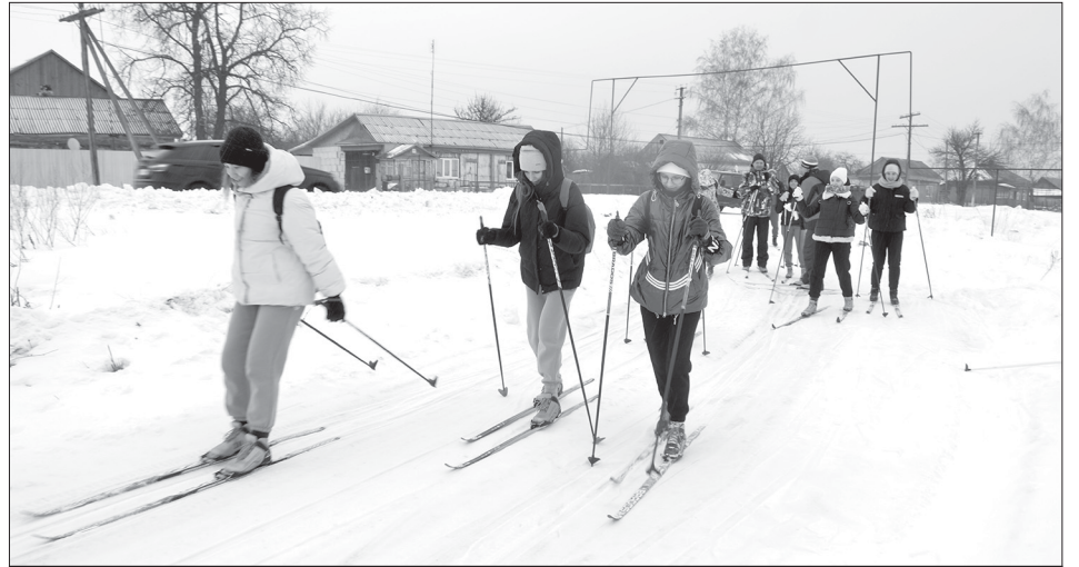
Старт лыжников из Турков