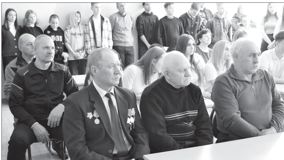
Встреча с воинами интернационалистами в Каменке

В понедельник, 12 февраля, из Турков стартовал очередной, уже 54-й лыжный поход по родному краю. В этом году он посвящён сразу двум событиям: 35-летию вывода войск из республики Афганистан и 30-летию Турковского историко-краеведческого музея.