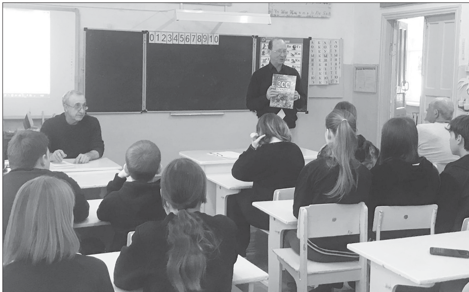
Краеведческая викторина в Семёновке