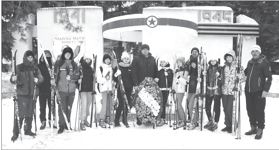
Встреча на Обелиске Славы в Турках перед началом похода