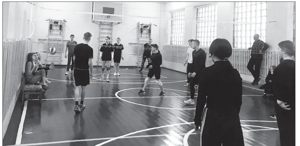
Волейбол – ещё одна добрая традиция лыжного похода по родному краю