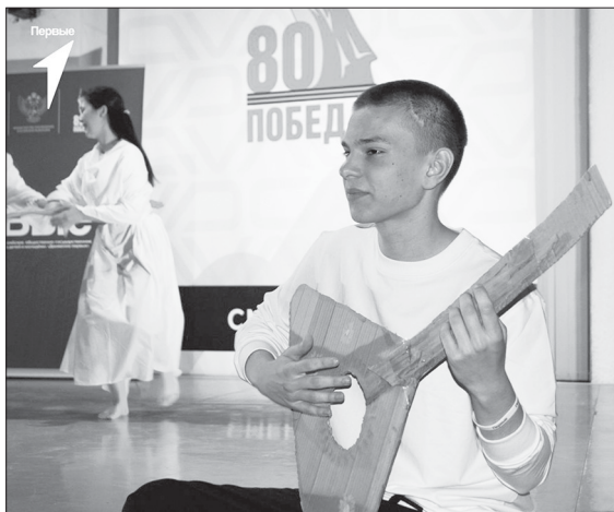
Вечернее мероприятие «Ретропоезд»

Всероссийский детский центр «Смена» собрал активистов из разных уголков страны. Около 400 ребят приехали на побережье Черного моря для участия в тематической смене «Деловые люди», в их числе оказался и я! С самого начала смены hh.ru проводил карьерный марафон, направленный на поиск своего «я» и приоритетной сферы деятельности. В течение смены велись различные уроки по созданию резюме, правильному поиску работы, а также по подготовке к собеседованию. Также выходили гайды по сопроводительным письмам и видео обучению для большой уверенности перед публичным выступлением. В конце курса мы прошли тест, где все участвующие поборолось за по-