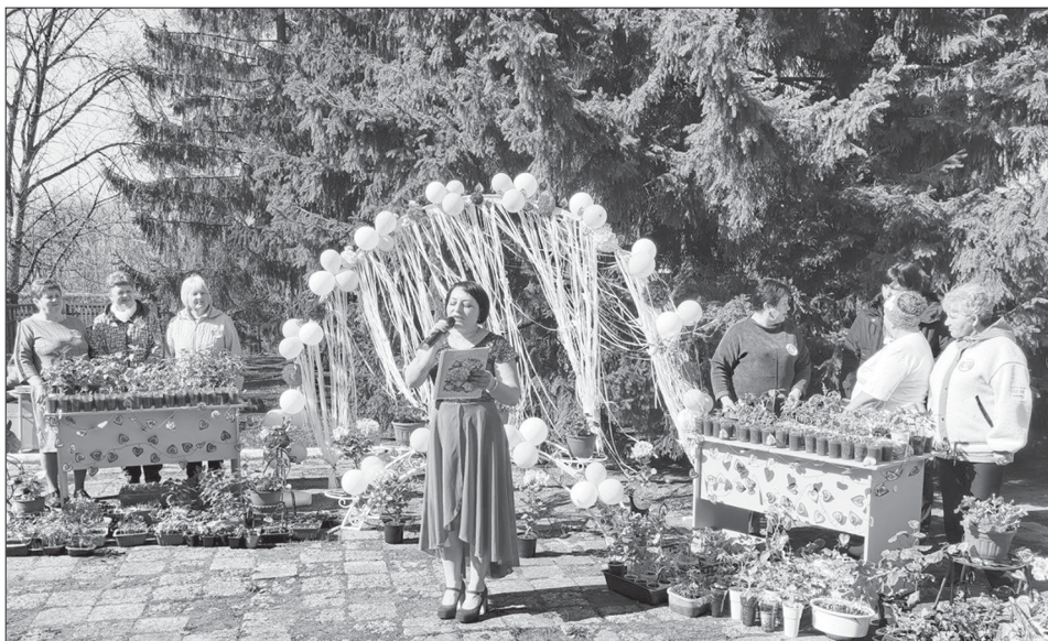
Концертная программа от социальных работников

Русскому человеку испокон веков присуще сострадание ближнему, проявление заботы к оказавшемуся в беде. С давних времен в России сестры милосердия ухаживали за ранеными солдатами, добровольцы шли на войну по зову сердца, тимуровцы помогали пожилым и ветеранам – это все примеры волонтерства.