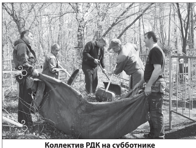
Коллектив РДК на субботнике

В этой важной акции приняли участие трудовые коллективы различных учреждений и организаций, а также неравнодушные жители, желающие внести свой вклад в сохранение чистоты и порядка на этом священном месте. На территории кладбища собралось значительное количество людей. Организованные группы, вооружившись граблями, мешками для мусора и другим необходимым инвентарем, приступили к работе. Участники субботника очищали территорию от скопившегося за зиму мусора: высохшей травы и веток, остатков искусственных цветов, увядших венков, пластиковых бутылок и прочих отходов. Солнечная погода благоприятствовала труду, создавая атмосферу общего подъема и взаимопомощи. Нельзя не отметить огромные усилия, приложенные каждым участником субботника. Однако, несмотря на трудности, все работали с энтузиазмом и пониманием важности дела. Ведь эта работа – не просто уборка, это выражение уважения к памяти ушедших земляков, дань уважения к их заслугам, к их жизни.