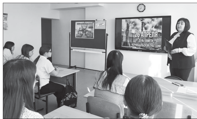
Урок памяти об Аварии на Чернобыльской АЭС

Урок подчеркнул необходимость помнить об уроках истории и нести ответственности за использовании ядерной