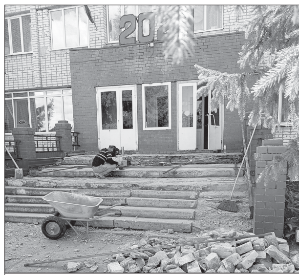
Начался ремонт крыльца РДК

В настоящее время действует Федеральный проект «Культура малой Родины» направлен на поддержку и повышение качества работы учреждений культуры. Проект призван обеспечить доступ всех граждан к участию в культурной жизни страны, разнообразить культурный досуг и расширить возможности для дополнительного образования в сфере культуры и искусства. В рамках этого проекта продолжаются ремонтные работы в Турковском районном Доме культуры. Производится текущий ремонт входной группы (центрального входа и запасных выходов).