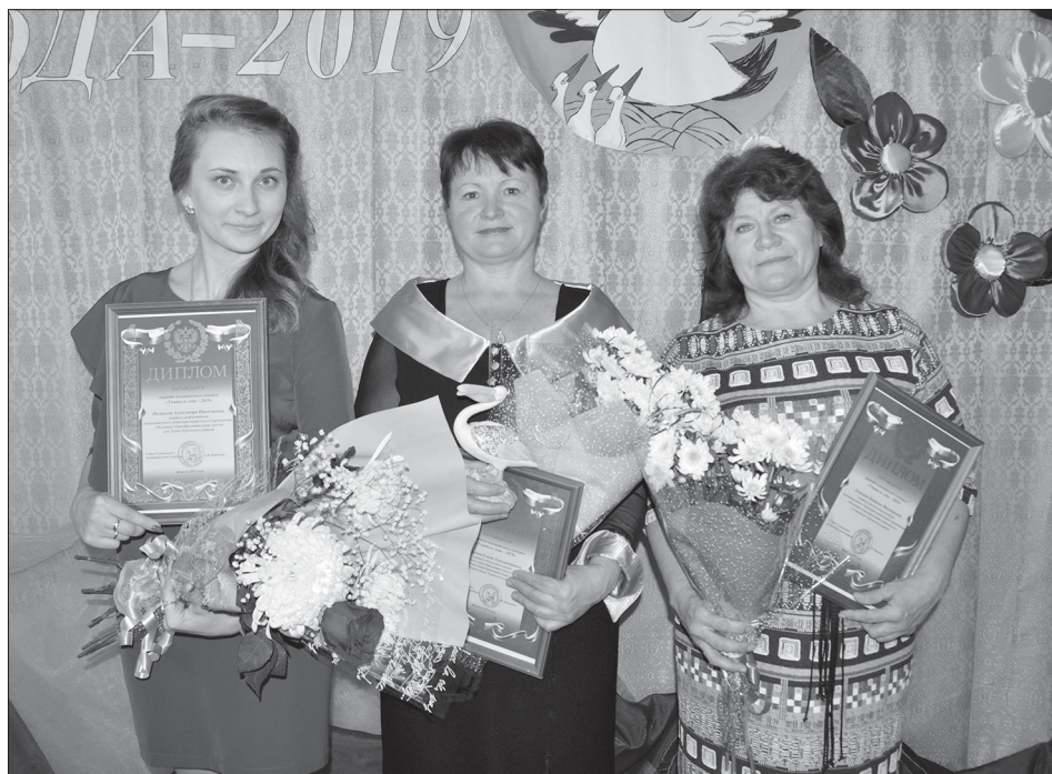
Фотография участников районного конкурса «Учитель года - 2019»

До появления Международного Дня учителя школьный праздник отмечали во многих странах на национальном уровне.