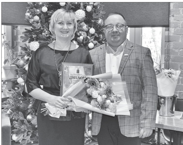
Финалист конкурса с министром

В нашем регионе 41 муниципальное издание. Каждое из них по-своему уникально, у каждого своя история, своя читательская аудитория. Районные редакции продолжают идти в ногу со временем, имеют собственный сайт, аккаунт в социальных сетях, что позволяет расширить охват читателей. Общий охват читательской аудитории всех муниципальных изданий нашего региона около полумиллиона