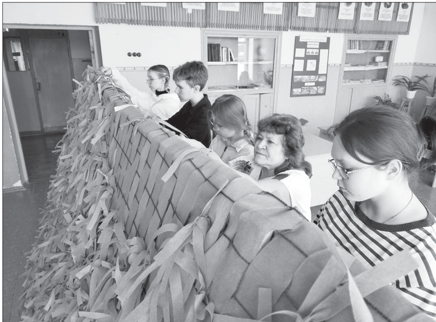
Плетение маскировочной сети учениками с. Студенка

История о школьном тыле, поддерживающем наших солдат