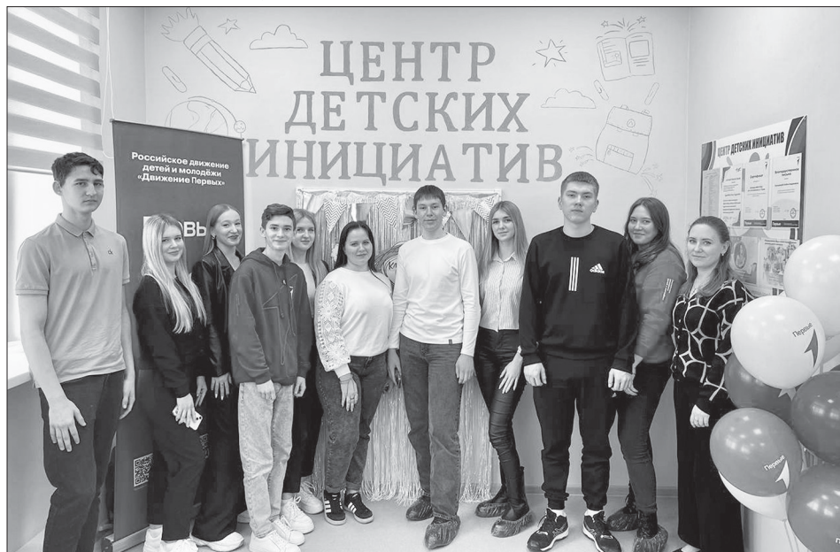
Участники классной встречи

Школьники получили ценные советы от первокурсников о студенческой жизни и успехе