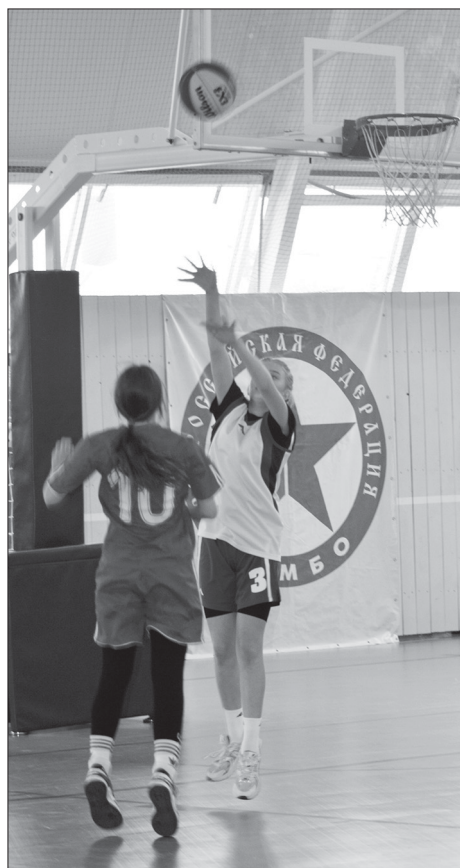
Напряжённый игровой момент

В Турках прошли соревнования по уличному баскетболу