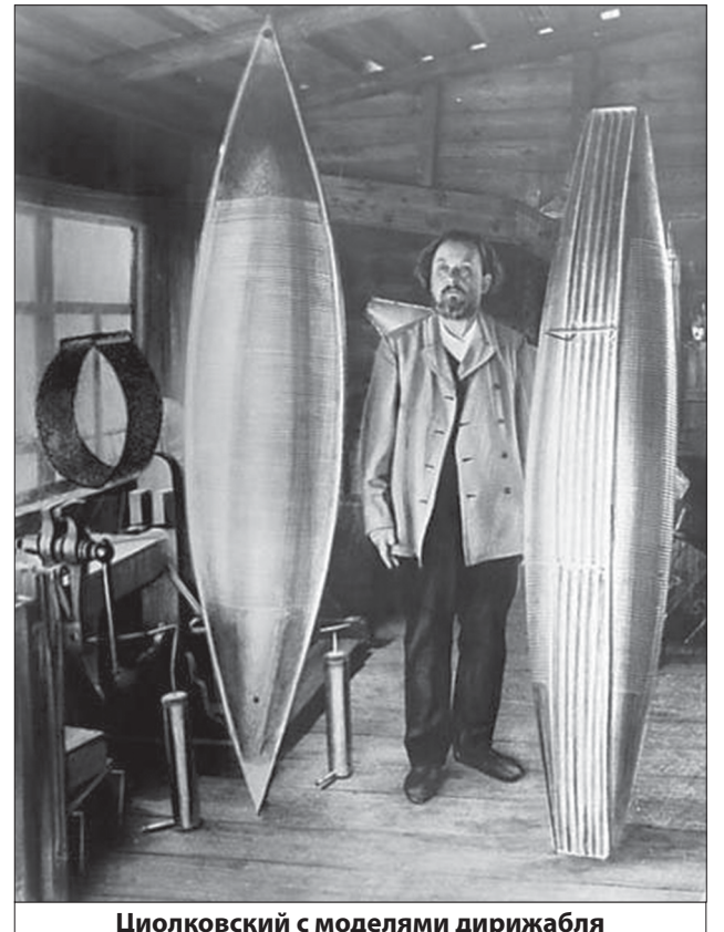
Циолковский с моделями дирижабля

Гений Циолковского не сразу был признан советской академией. Он мог бы умереть голодной смертью, если бы не вмешательство Общества любителей мироведе-