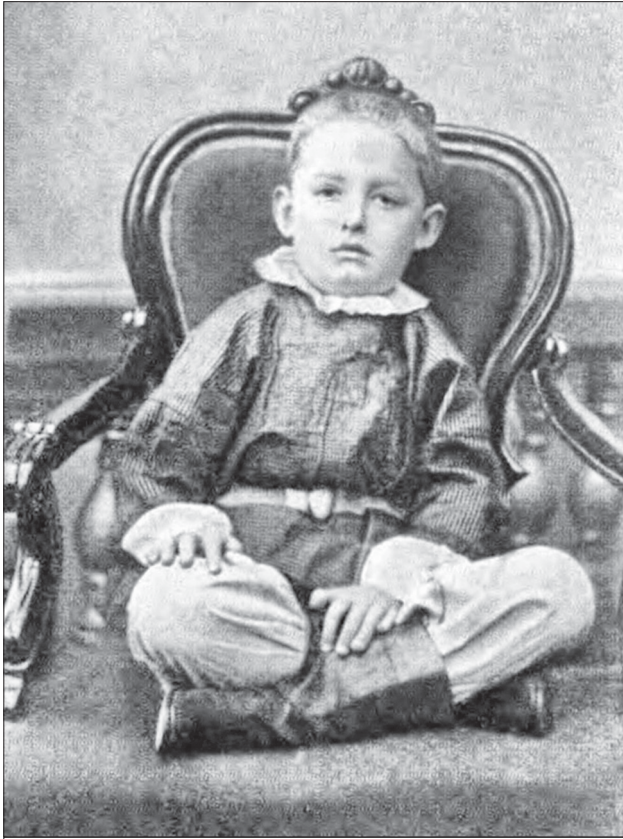
Константин Циолковский в детстве

Человек тысячелетиями смотрел в звездное небо, задаваясь множеством вопросов о том, как устроена Вселенная, есть ли там разумные существа, и мечтал когда-то побывать на других планетах. Благодаря одному из них, самоучке-изобретателю, философу, учителю Константину Эдуардовичу Циолковскому, мечта человечества постепенно воплотилась в жизнь. Великий ученый посвятил свою жизнь тому, чтобы однажды все увидели в космосе первого человека, благодаря его разработкам появились мощнейшие самолеты, ракеты и орбитальные станции. Циолковский стоял у истоков зарождения теоретической космонавтики, он первым нашел обоснование для применения ракет в космических полетах, доказал необходимость использования так называемых «ракетных поездов», которые были прототипом современных многоступенчатых ракет. Его многие не понимали, общественное мнение не раз порицало труды великого ученого, однако Константин Эдуардович никогда не сдавался, мечтая о покорении космоса.