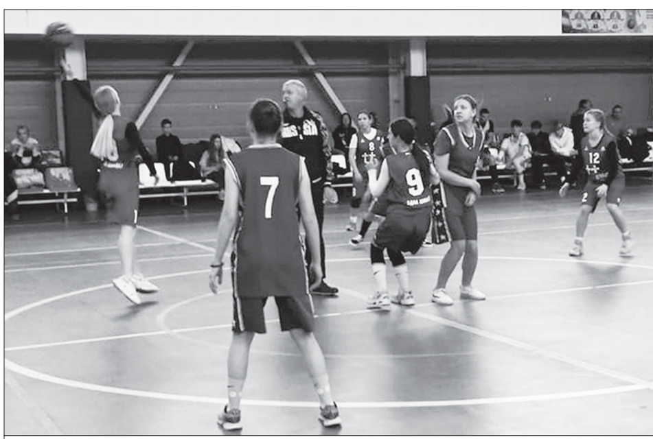
На баскетбольной площадке команды г. Балашова и с. Перевесинки

В Балашове завершился дивизионный этап Всероссийского Чемпионата Школьной баскетбольной лиги «КЭС-Баскет» среди учащихся 7–11 классов