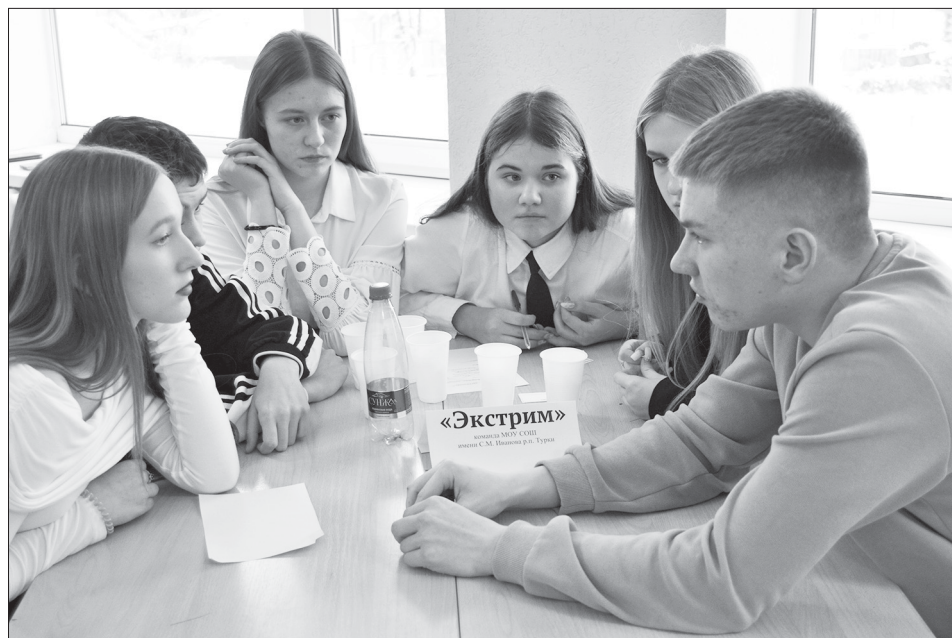
За игровым столом команда интеллектуалов школы имени С.М. Иванова

Турковские знатоки показали высокий уровень интеллекта.