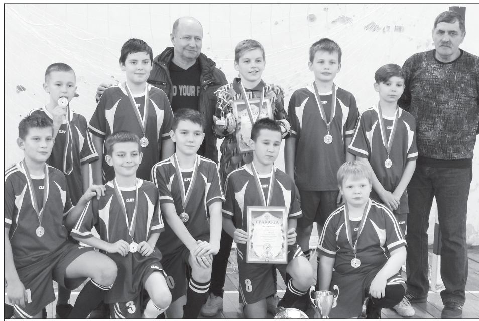
«Серебряные» призеры турнира с заслуженными наградами.

Юные футболисты Турковского муниципального района заняли почетное второе место на турнире, посвященном Дню Героев Отечества