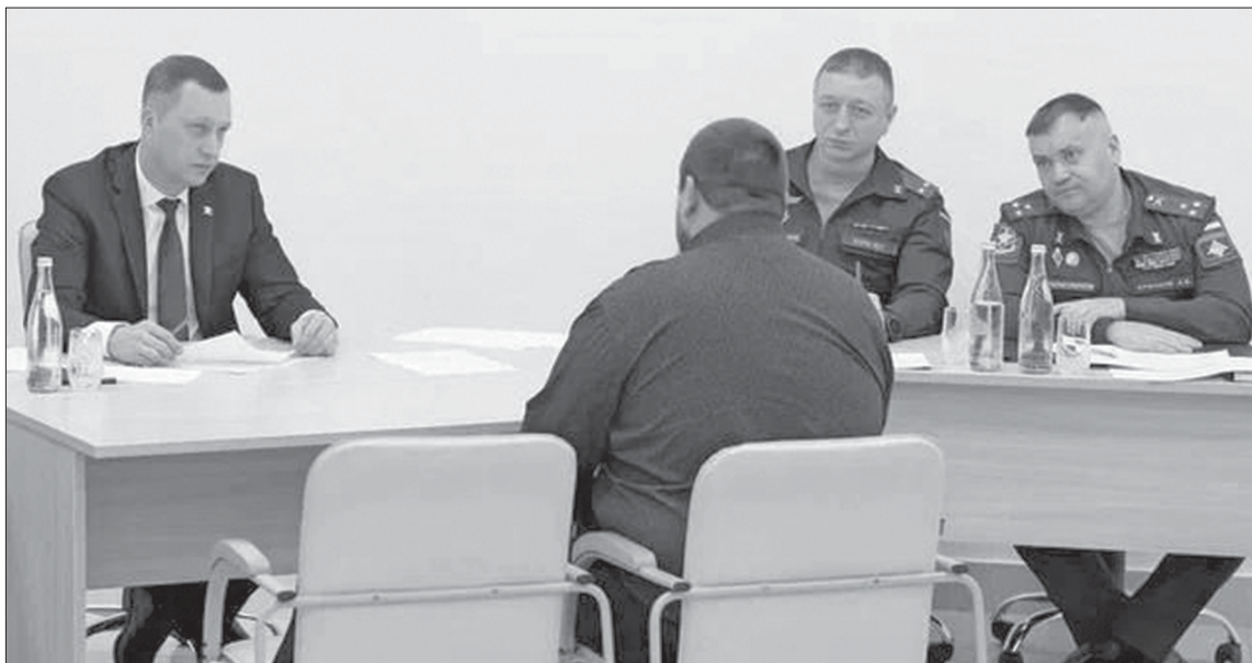
Губернатор Роман Бусаргин провел постоянно действующее совещание с зампредами Правительства, министрами и руководителями районов.

Были подведены итоги прошедших во всех муниципалитетах личных приемов участников СВО и членов их семей. В этот день к главам районов обратились 147 человек. Было озвучено 182 вопроса. Большая часть обращений касалась бытовых тем, благоустройства, помощи в оформлении документов, проведении медицинских обследований. Все сигналы направлены в профильные ведомства и будут проработаны. Всего с начала проведения личных приемов участников спецоперации и их близких приняты 4682 человека, они озвучили более 5500 вопросов. Перед Министерством культуры глава региона поставил