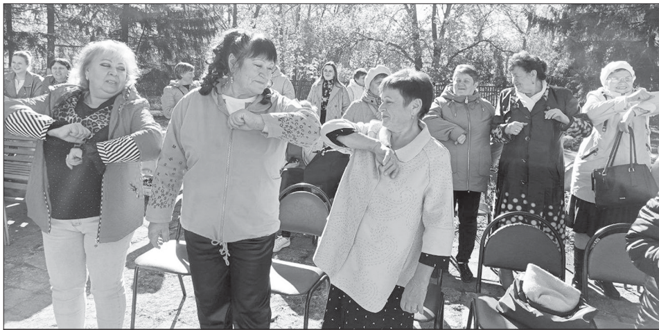
Гости фестиваля в Турках

Особым, пронзительным моментом второго дня фестиваля стало написание писем на фронт. Жители и гости села проявили единство, активно участвуя в сборе гуманитарной помощи и средств на приобретение жизненно необходимого оборудования для наших земляков, выполняющих свой долг в зоне СВО.