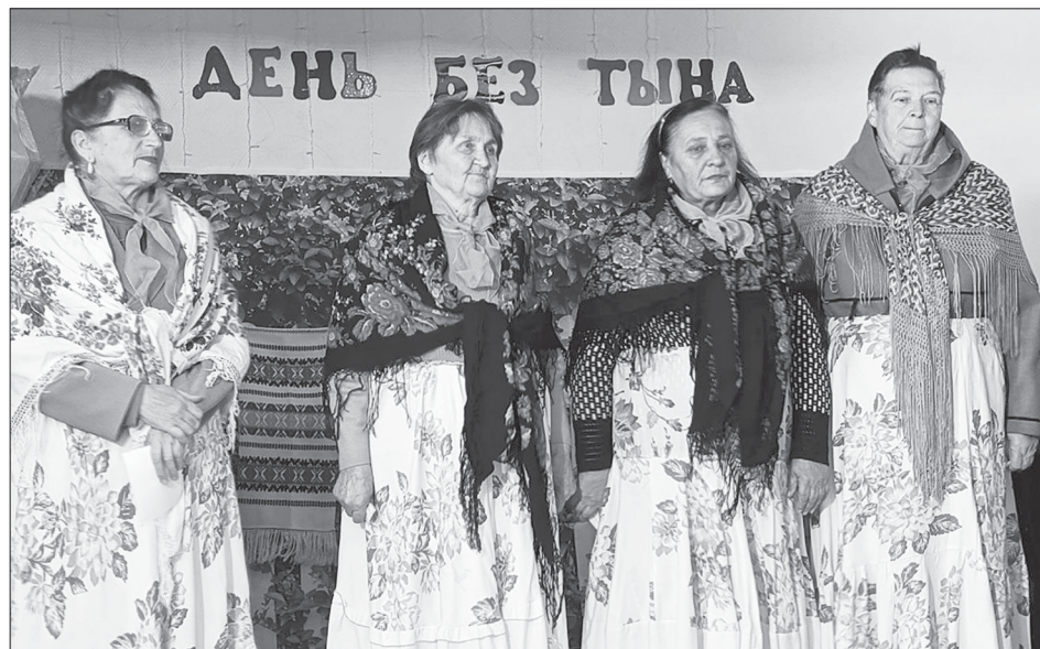
Концерт в Шепелёвке

Успех Фестиваля – заслуга его организатора – ОПФ «Сердце Родины», а также соорганизаторов: