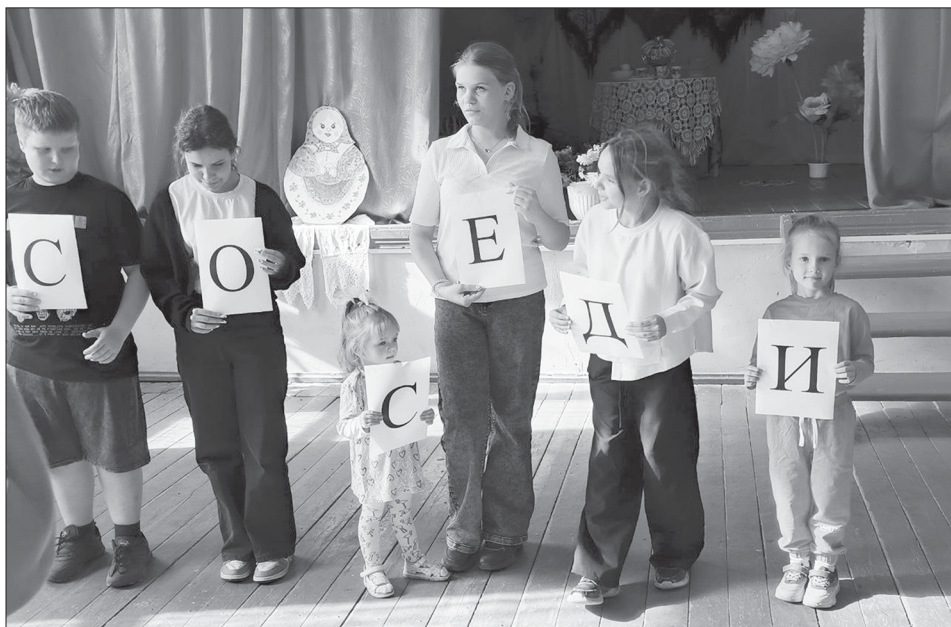
Моменты фестиваля в Рязанке

Праздник получился очень душевным и теплым, как и положено «соседским посиделкам».