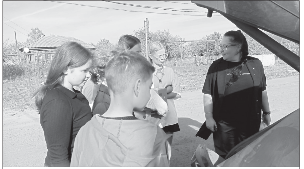
Погрузка гуманитарной помощи бойцам СВО

Сбор гуманитарной помощи стал не просто акцией, а целым событием. Дети с энтузиазмом участвовали во всем: собирали вещи, упаковывали их, писали письма. Каждое дело делалось с любовью и заботой. В письмах ребята писали о своей жизни, делились радостью и мечтами, дарили нашим защитникам слова поддержки и благодарности. Все это необходимо солдатам, чтобы немного смягчить тяжесть боевых условий, чтобы подарить им тепло и уют. Важно, что сбор гуманитарной помощи состоялся в школе, там, где закладываются основы гражданственности и патриотизма, где формируются нравственные ценности.