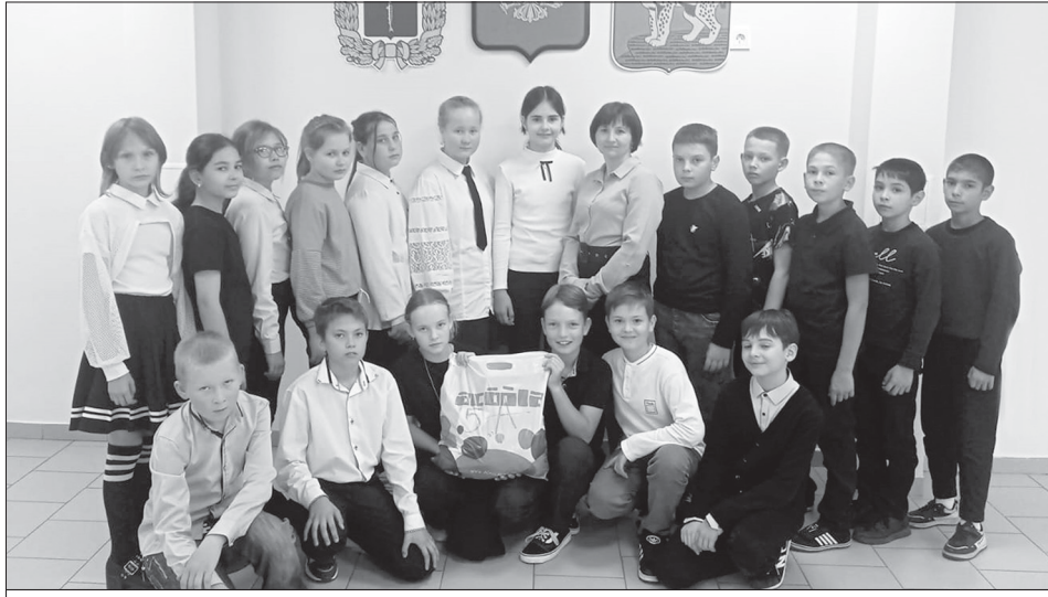
Ученики 5 А класса

В Турковском районе, 50 мобилизованных земляков которого участвуют в спецоперации на Украине, школьники не остаются в стороне от акции помощи бойцам СВО. Ученики МОУ СОШ р.п. Турки считают, что их поддержка защитникам нашей Родины сейчас особенно важна, и организовали сбор гуманитарной помощи для наших бойцов, доказывая, что патриотизм и сострадание не знают возраста.