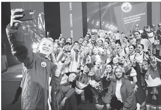
В Саратове завершились XII молодежные Дельфийские игры России.

В Саратовском государственном цирке имени братьев Никитиных состоялась торжественная церемония закрытия игр и гала-концерт.