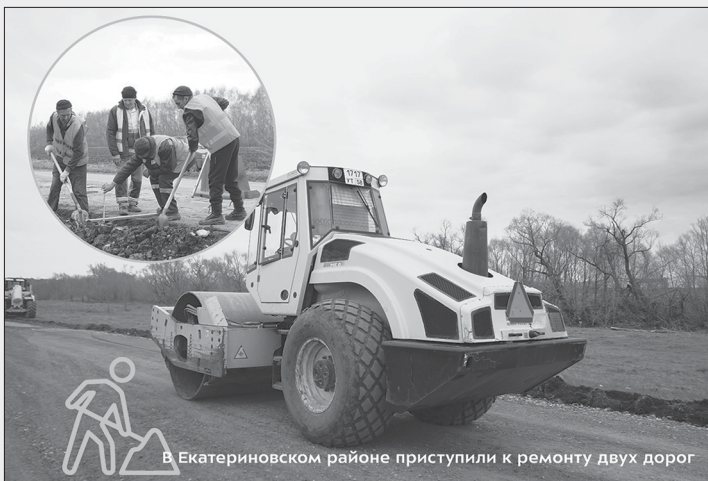
В Екатериновском районе приступили к ремонту двух дорог

Всего в этом году по нацпроекту «Безопасные качественные дороги» планируется привести в нормативное состояние 320 км трасс и 13 мостов и тепловых проводов.