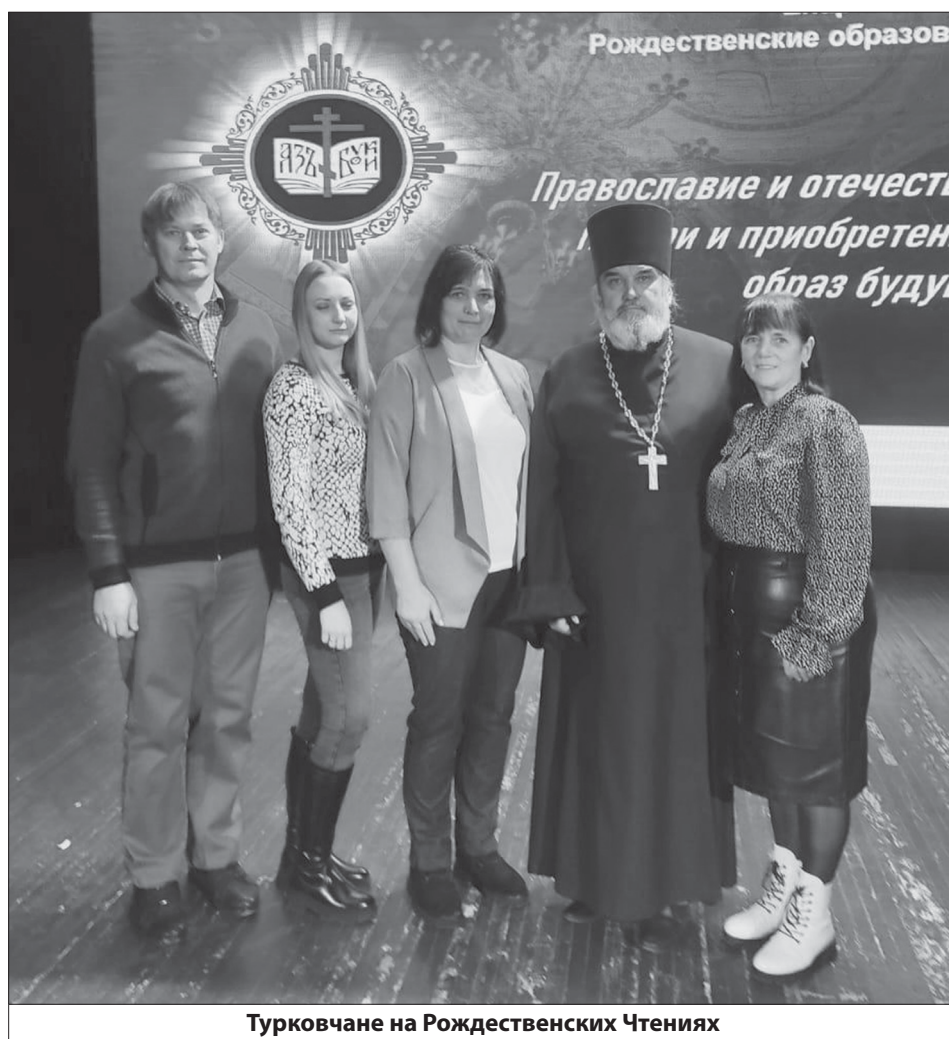
Турковчане на Рождественских Чтениях

В этом году тема Чтений была сформулирована как "Православие и отечественная культура: потери и приобретения минувшего, образ будущего". Сегодня разговор о русской культуре, о сохранении ее уникальности особенно актуален. "Православие больше тысячи лет возделывает русскую цивилизацию. Многие века именно вера формирует наши ценности, наши идеалы, наше мироощущение. Как будет развиваться русская культура? Как Церковь может помочь ей сохранить глубину и принести пользу?" Эти важные вопросы прозвучали еще в мае этого года на заседании Священного Синода Русской Православной Церкви, когда происходило утверждение темы. Чтобы обсудить их, в зале Балашовского драматического театра собрались священнослужители, педагоги, работники медицины, военнослужащие, студенты, прихожане храмов, подведомственных епархии.