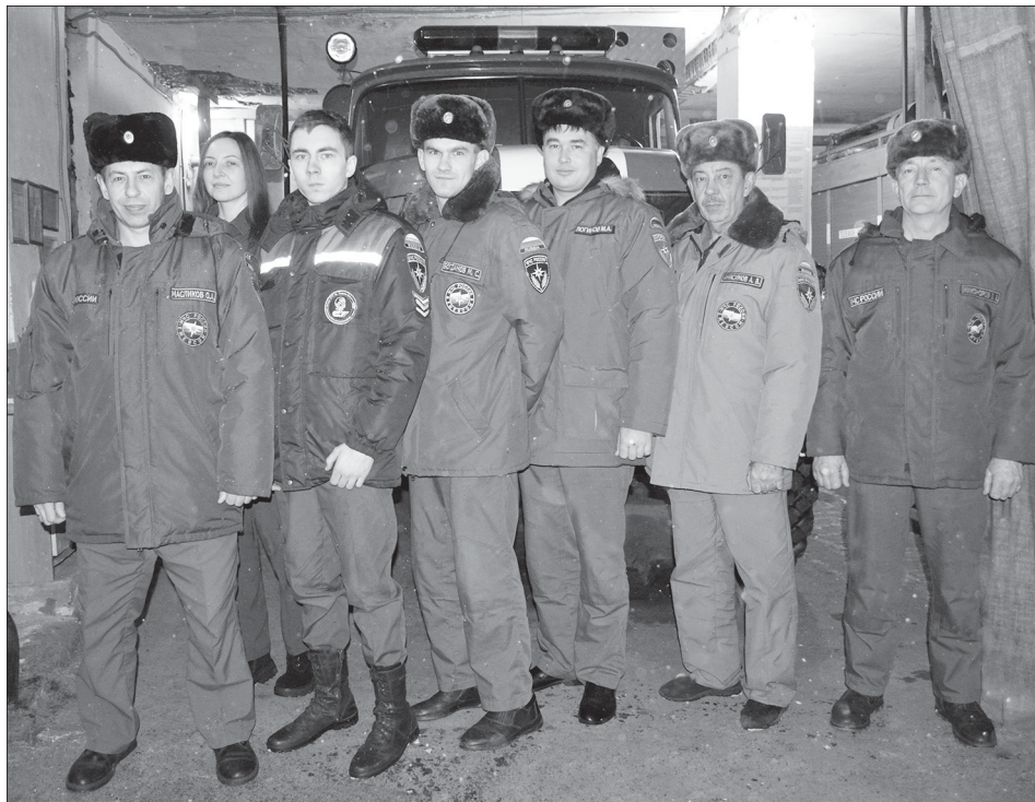
2 караул 61-й пожарно-спасательной части

За текущий год в часть поступило 199 звонков, 31 из них – вызовы на пожары. И большинство из них связано с возгоранием травы. Сколько бы ни говорилось, люди упорно продолжают устраивать пал прошлогодней растительности весной, а пожарные выезжают для их ликвидации. Другой бич пожарно-спасательной части – ложные вызовы. В этом году их было семь. Примечательно, что подобные выходы позволяют себе не только дети, но и взрослые люди, находящиеся в нетрезвом состоянии. А ведь ложный вызов мо-