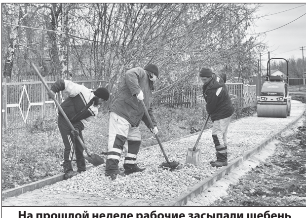
На прошлой неделе рабочие засыпали щебень

Когда пишутся эти строки, проходит заключительный этап строительства тротуара по улице Советской, от обелиска Славы до детского сада №3 «Колокольчик», рабочие с использованием малой техники и ручного труда укладывают асфальт. Появление тротуара внесёт ощутимый вклад в безопасность дорожного движения, ведь теперь турковчанам не придётся ходить по обочине дороги, к их услугам готовая дорожка с современным асфальтным покрытием.