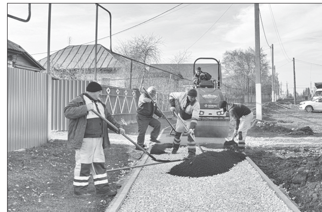
И вот он завершающий этап!