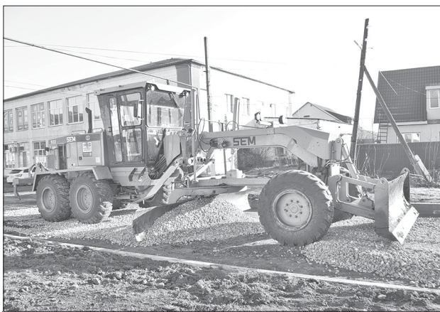
Выравнивание щебня на улице Ленина

Активно продолжаются работы по благоустройству рабочего посёлка. Уже установлены тротуарные бордюры, засыпан и разровнен щебень на пешеходной зоне по улице Ленина (от автостанции до магазинов «Гроздь» и «Магнит-косметик»). К работам привлечена самая передовая техника. Идёт укладка асфальта.