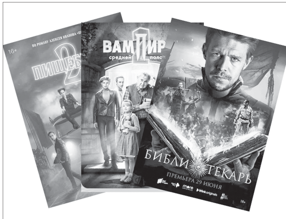
Любимые молодёжью сериалы

Ещё один из предшественников семейства «мистических-вампирических» – сериал «Пищеблок», который рассказывает нам о загадочных исчезновениях в дет-