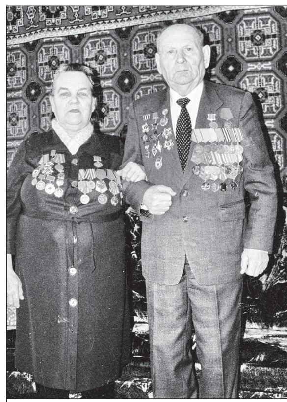
На рубеже веков