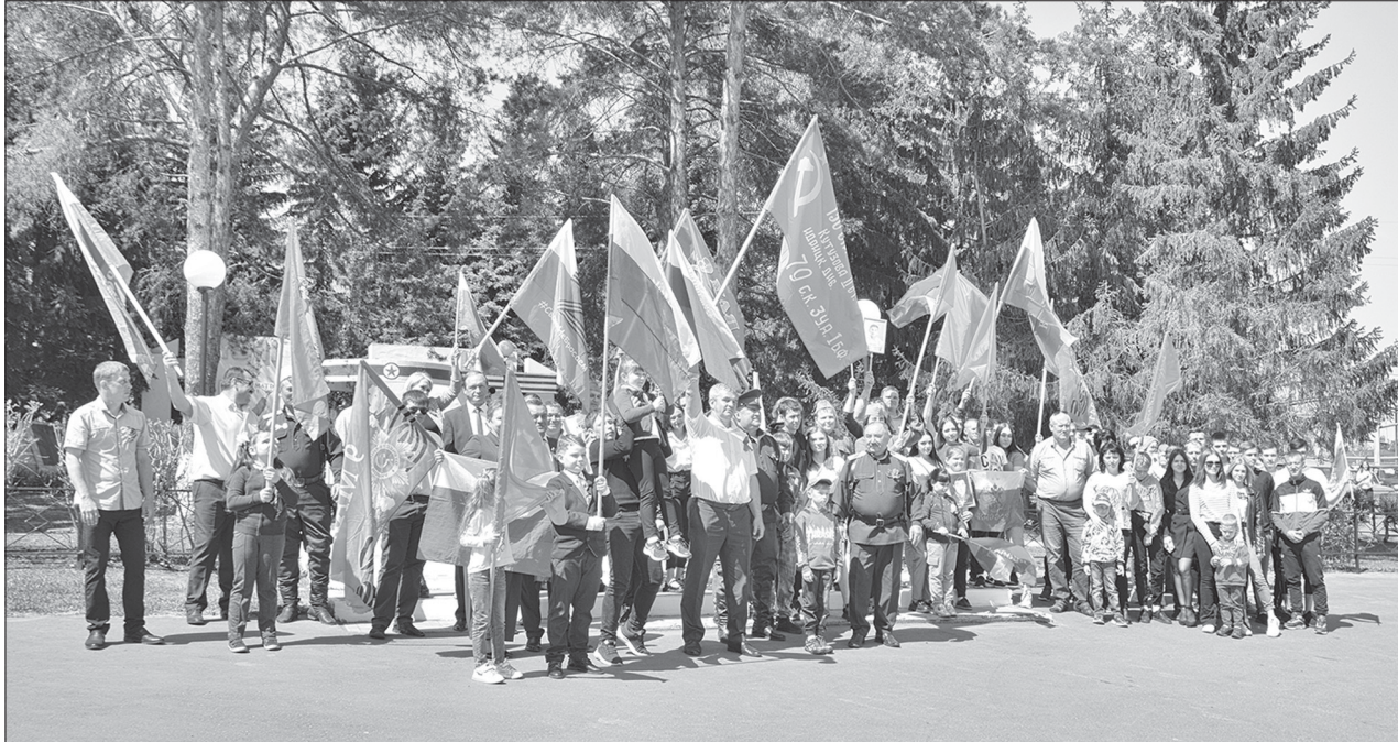
Участники автопробега, посвящённого 77-й годовщине Победы на Обелиске Славы