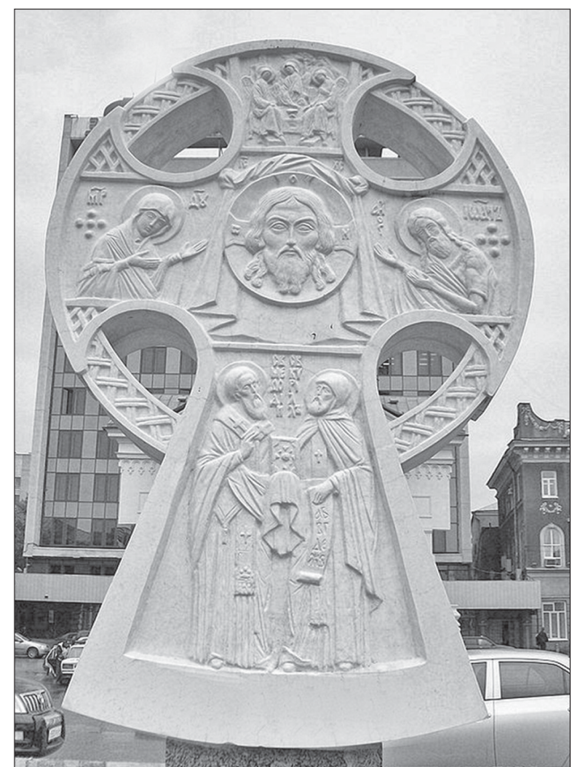
Памятный крест Кириллу и Мефодию (Саратов), лицевая сторона.