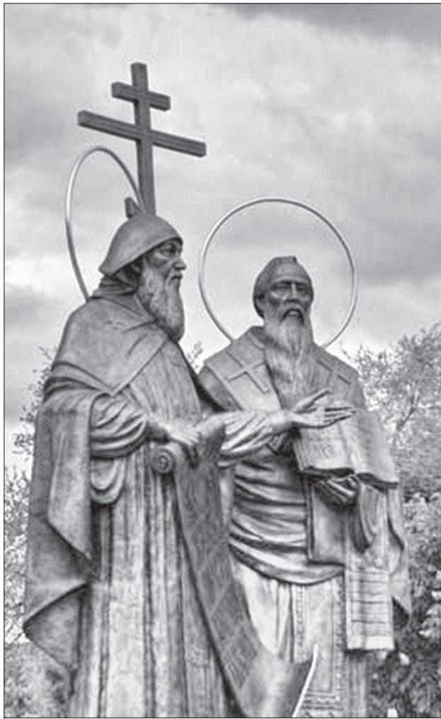
Памятник Кириллу и Мефодию (Саратов)

Ежегодно, 24 мая, во всех славянских странах, в том числе и в России отмечают День славянской письменности и культуры, торжественно прославляя их создателей - святых равноапостольных братьев Кирилла и Мефодия. Этот праздник для нас, русских, является праздником просвещения, родного языка, слов, книги, литературы. День славянской письменности и культуры – единственный в нашей стране церковно-государственный праздник. На государственном уровне его отмечают и в Болгарии, Чехии, Словакии, Северной Македонии, в Приднестровье (Молдавии), Белоруссии. По пышности и масштабности празднования Болгария превосходит все другие славянские страны. По сей день здесь устраиваются праздники букв и викторины знаний; венками из живых цветов школьники украшают портреты Кирилла и Мефодия, возлагают цветы к их памятникам, звучит гимн, посвященный равноапостольным создателям славянской азбуки.