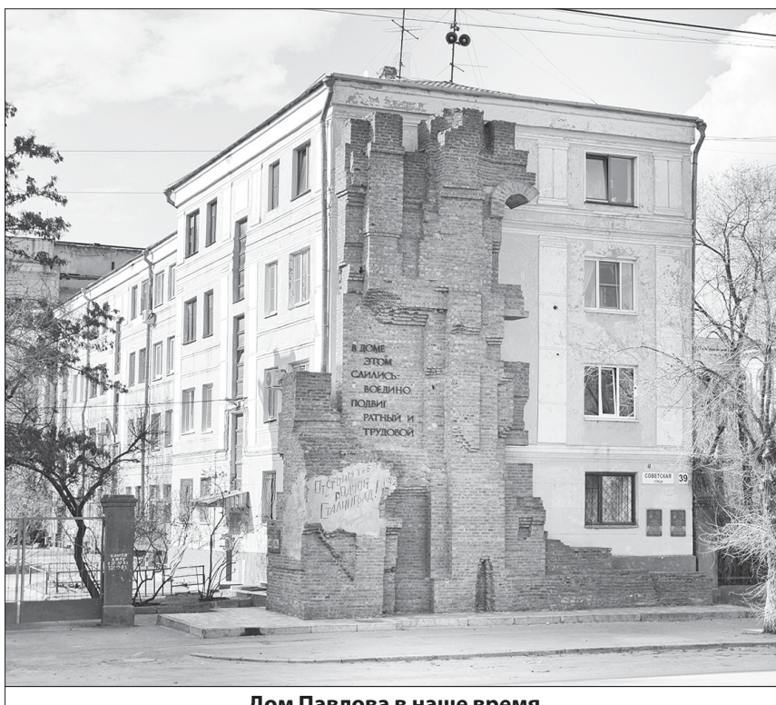
Дом Павлова в наше время