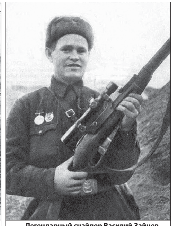
Легендарный снайпер Василий Зайцев

меткой стрельбе 28 красноармейцев. Сам с помощью усовершенствованной винтовки Мосина (установил на нее прицел от противотанкового ружья), ни разу не промахнулся, стреляя по фашистам.