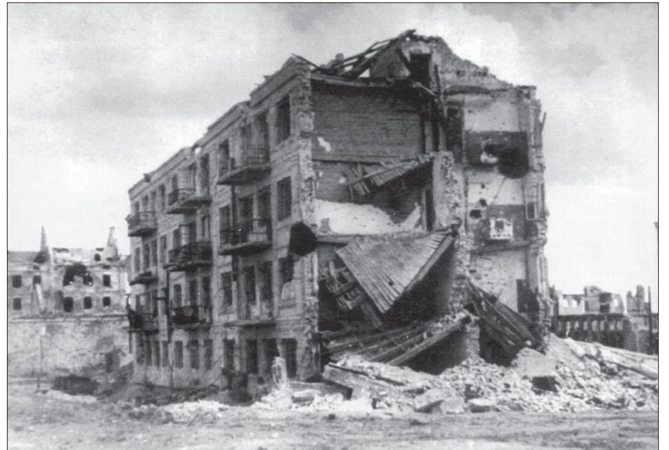
Дом Павлова в те страшные дни