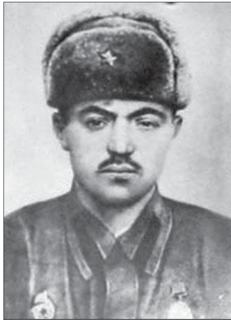
Комвзвода Яков Павлов

Одним из многих героев-сталинградцев является и снайпер Василий Зайцев, уничтоживший 225 немцев в ходе боев за город. Простой парень с Урала, он в самом начале войны добровольцем ушел на фронт. Оказавшись в Сталинграде, организовал «школу снайперов», выучив