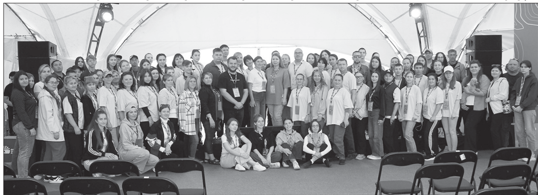
Комитет молодежной политики Саратовской области

Близ села Белогорское в Красноармейском районе прошел четырехдневный молодежный форум