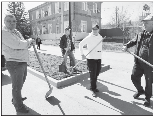
Сотрудники администрации района

Субботник – это не просто уборка мусора, это глубоко укоренившаяся традиция, объединяющая людей разных возрастов и профессий общей целью – сделать окружающий мир чище и краше. Это прекрасная возможность продемонстрировать свою гражданскую позицию, внести свой вклад в благоустройство родного района, города, страны.