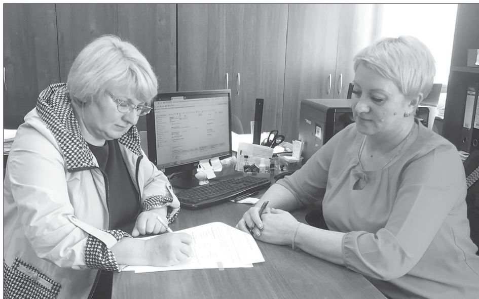
Заклучение социального контракта по направлению «личное подсобное хозяйство»

– Государственная социальная помощь на основании социального контракта оказывается малоимущим семьям и малоимущим одиноко проживающим