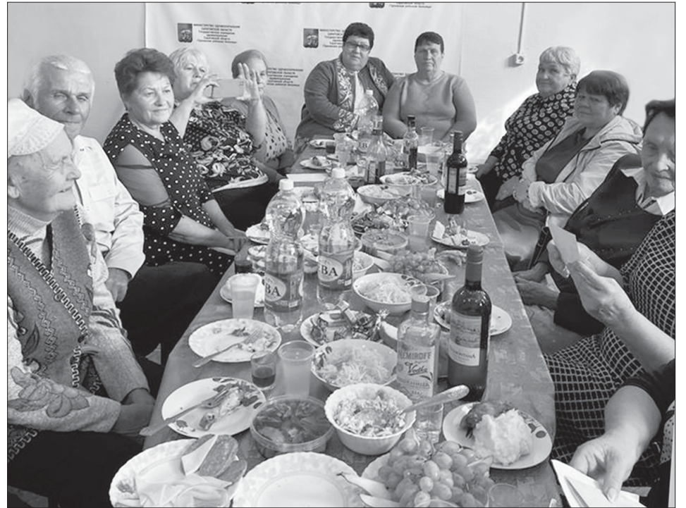
Празднование Дня пожилого человека в Турковской РБ