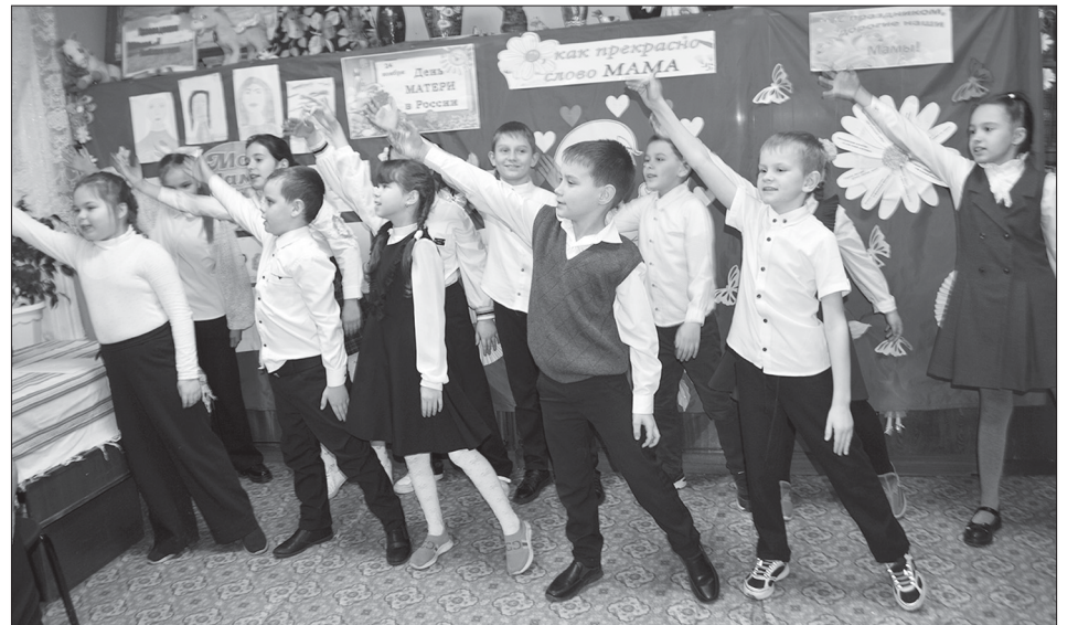
Музыкально-театрализованная потешка «Божья коровка» в исполнении учащихся 3 класса

Детская библиотека р.п. Турки в канун Дня матери радушно открыла двери литературной гостиной