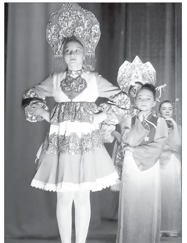
Юные участницы театра моды «Эйфория»