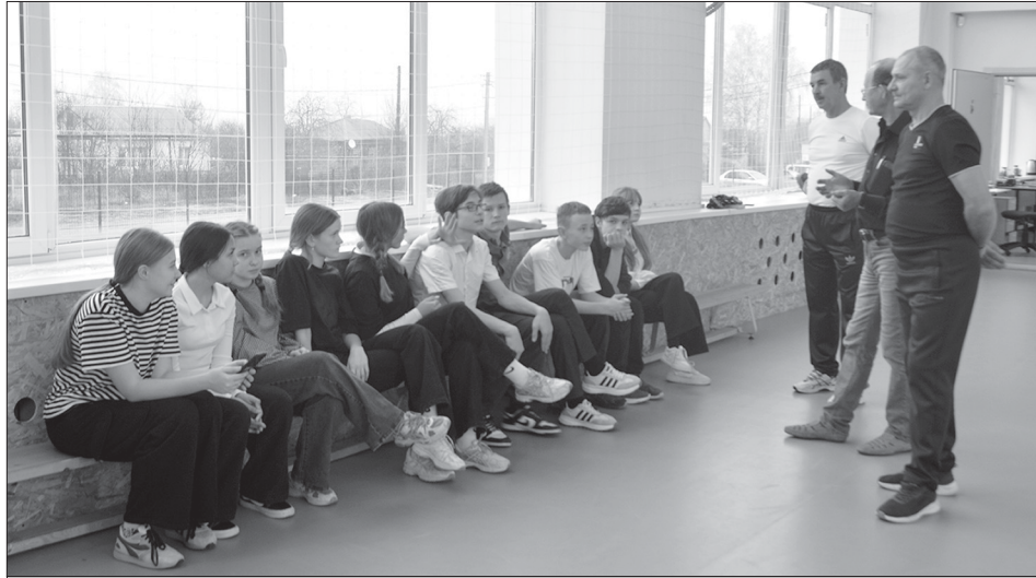
Идём в поход, ребята? Да!!!

В обширной программе этой спортивно-патриотической акции – несколько тематических блоков. Для сельских школьников будет подготовлена интересная краеведческая викторина по истории Великой Отечественной войны. Очень надеемся, что на этих встречах они расскажут нам о преподавателях родной школы, которые сражались на фронтах