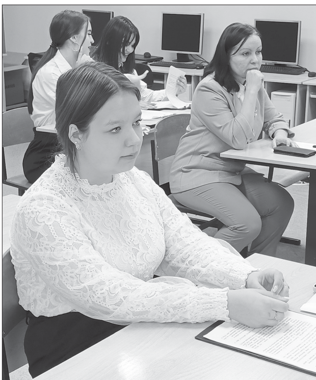
Моменты научно-практической конференции

Работа конференции проходила в трех секциях. Проекты, представленные участниками, касались разно-