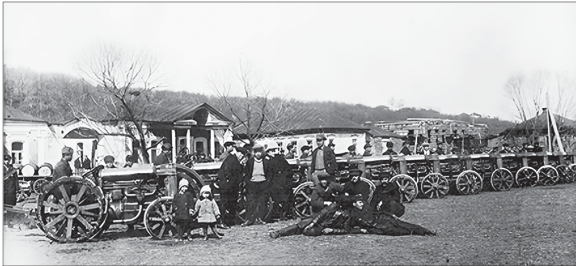
Прибыли трактора. Турки. 1932 год.