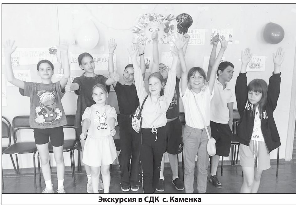
Экскурсия в СДК с. Каменка

храма в с. Чириково и визит в пожарную часть.