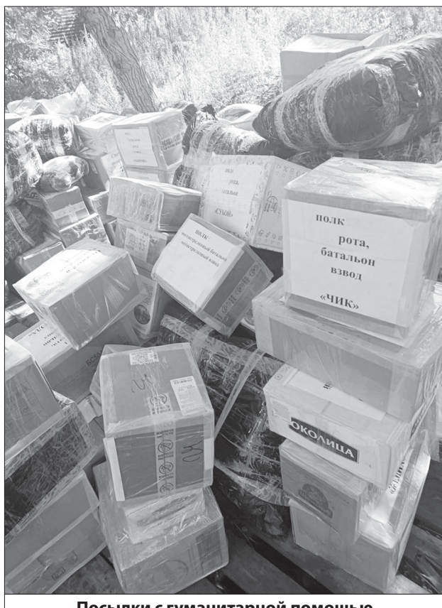
Посылки с гуманитарной помощью

«Мы сформировали посылки с расчетом на два ме-