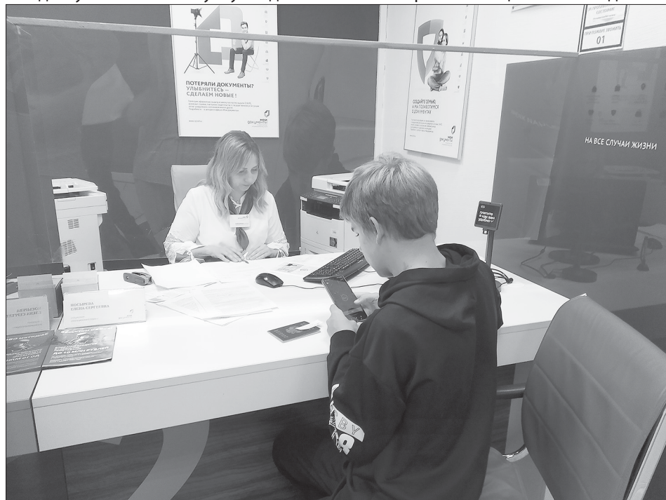
Обслуживание посетителя в МФЦ