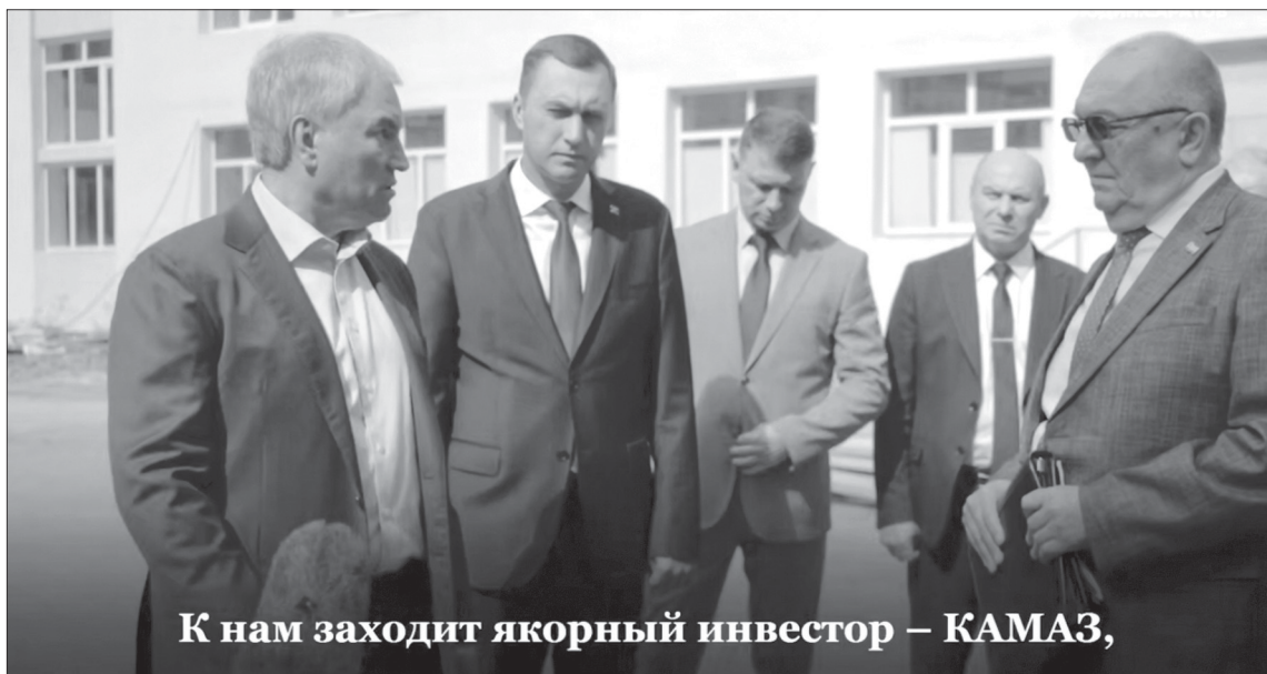
К нам заходит якорный инвестор – КАМАЗ,

Председатель Государственной Думы Вячеслав Володин в ходе рабочего визита затронул тему открытия в Саратове завода «КамАЗ».