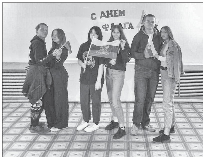
Участники фоточелленджа «Цветы моей России» в Шепелёвке