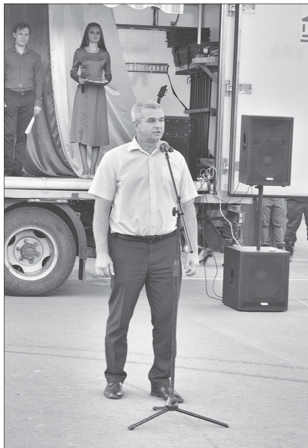
Выступление главы района