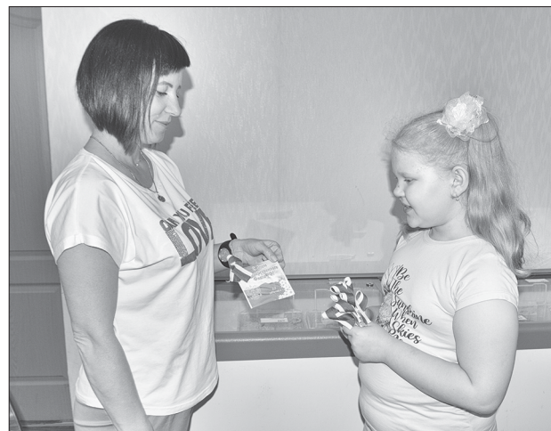
Вручение ленточки в виде триколора