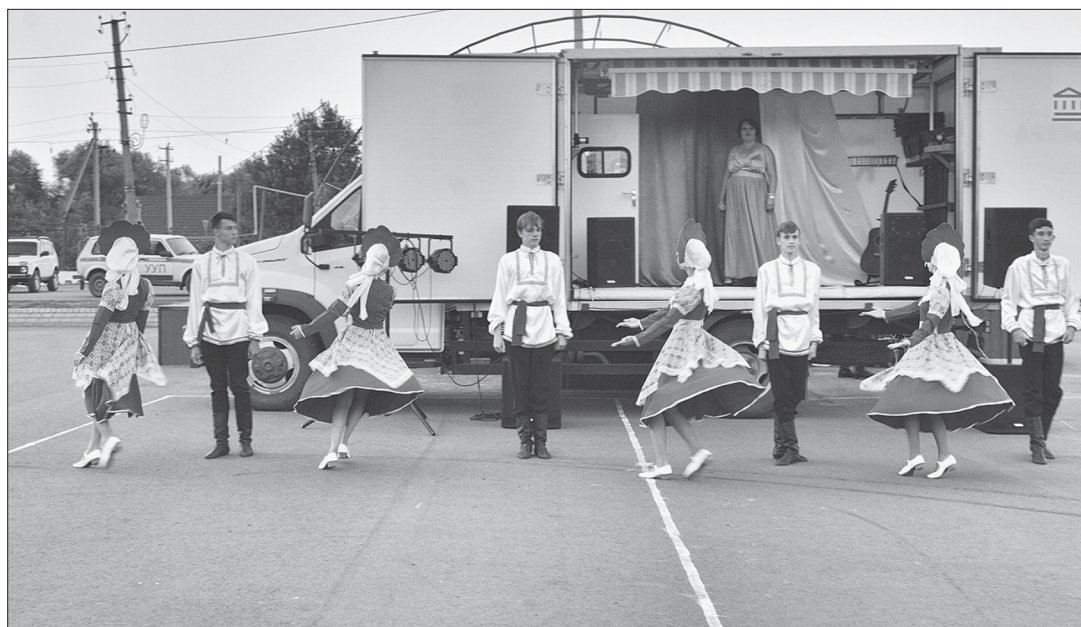
Номер коллектива «Вдохновение» на празднике в Турках