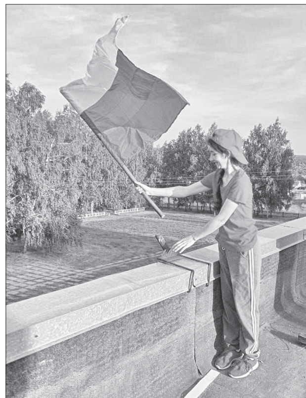
Установка флага над Перевесинским СДК