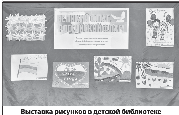
Выставка рисунков в детской библиотеке

День Государственного флага – один из главных праздников нашего государства. Как и во всей стране его отметили в Турках.