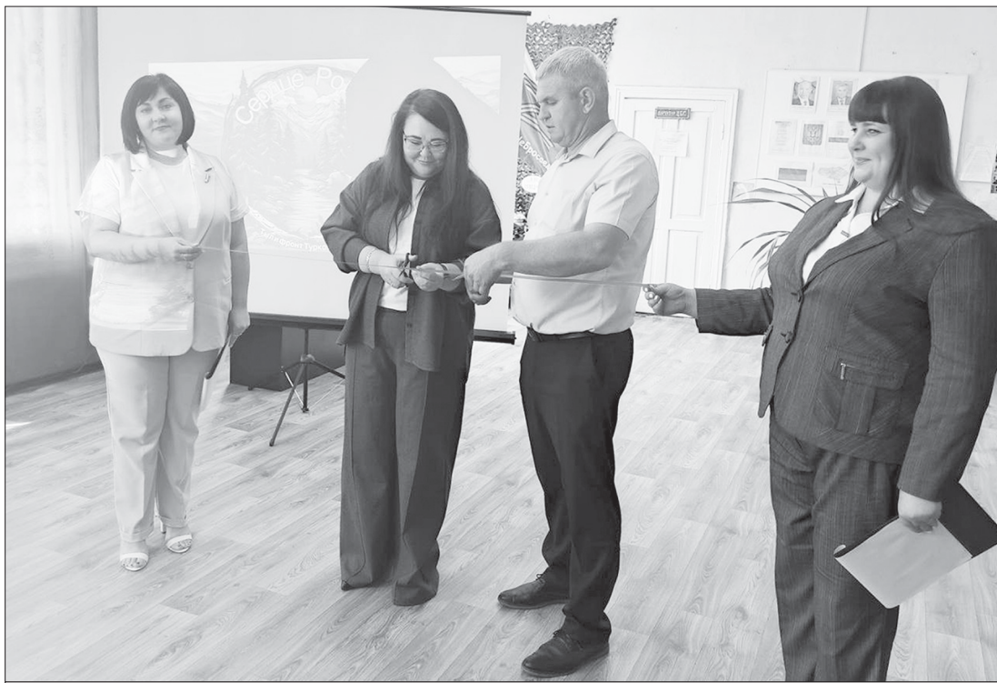
Открытие фонда «Сердце Родины»

“Сердце Родины” зовет к действию: в нашем районе дан старт работе нового фонда