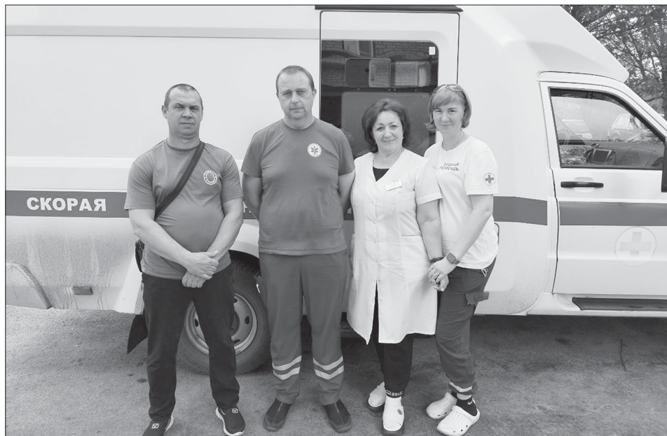
Дежурная бригада скорой медицинской помощи

О работе бригады скорой медицинской помощи