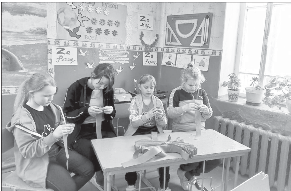
Ученики готовят ленты для маскировочных сетей

Жители Шепелевки объединились для поддержки своих героев