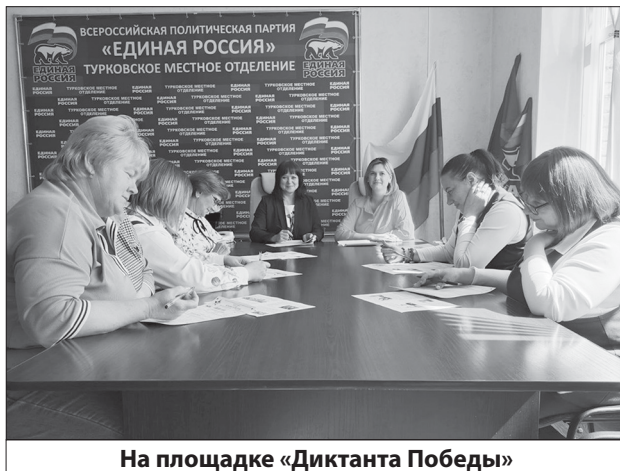
На площадке «Диктанта Победы»

Участникам было предложено ответить на вопросы, охватывающие различные аспекты Великой Отечественной войны: ключевые сражения, герои, даты, исторические факты и события. Диктант стал не