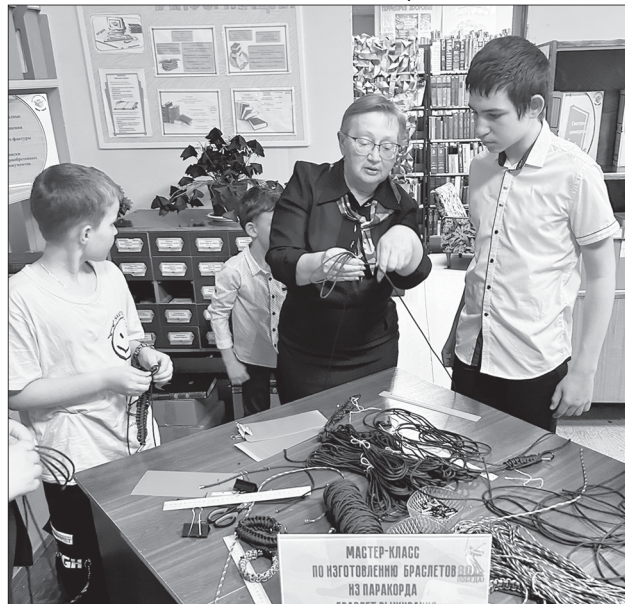
Мастер-класс по изготовлению браслетов выживания

Не менее значимой стала благотворительная акция «Ко-