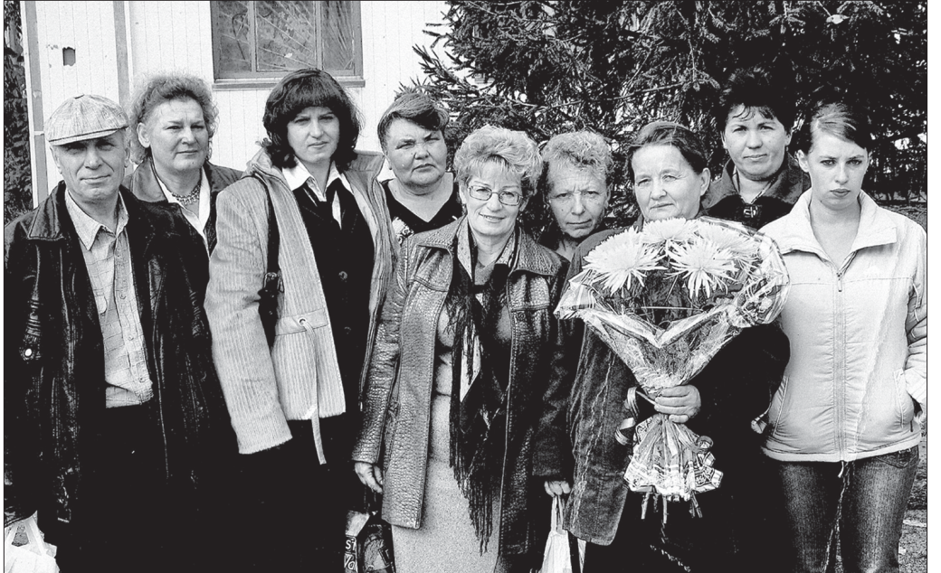
Коллектив на одном из прошлых юбилеев