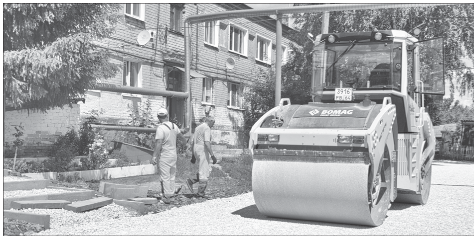
◆ АДМИНИСТРАЦИЯ ИНФОРМИРУЕТ