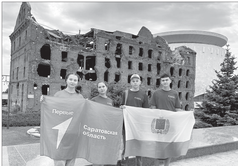
Университетские смены в Волгограде

Более семидесяти одаренных школьников, представляющих двадцать регионов России, провели незабываемые десять дней в героическом городе-герое Волгограде, участвуя в тематической «Университетской смене» под названием «Подвиг России».