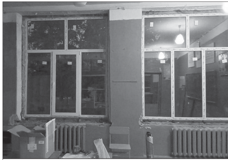
Замена окон в Перевесинской школе