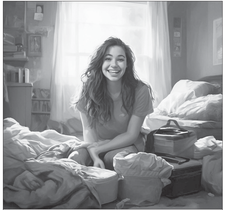
Типичная студентка в общежитии по мнению нейросети

- Общежитийские мероприятия. Многие общежития организуют различные мероприятия: вечеринки, конкурсы, спортив-