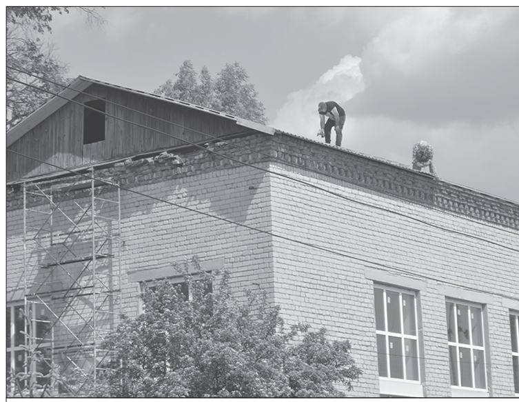
Ремонт кровли на старом здании основной школы