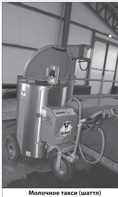
Молочное такси (шаттл)

теристики получаемого молока. Когда доение заканчивается, молокопровод тщательно продувается воздухом, чтобы не пропала ни одна капля, а затем промывается щелочным раствором, водой и насухо продувается воздухом. И робот снова готов к доению. Полученное молоко сейчас используется для внутренних потребностей предприятия – для отпавивания телят.