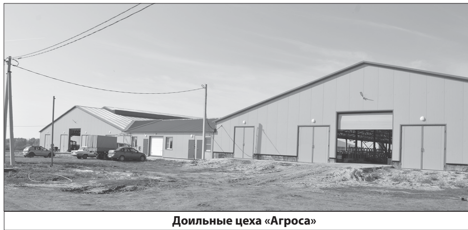
Доильные цеха «Агроса»

В современной России, к сожалению, животноводство является не самым популярным направлением сельскохозяйственной отрасли. Но в советскую эпоху считалось, что животноводство обязательно должно быть развито в каждом хозяйстве, так как существует возможность использования побочной продукции растениеводства (например, соломы), с начала девяностых это направление стало постепенно отмирать. Высокие издержки делали его не просто нерентабельным, оно, порой, могло превратить хозяйство в убыточные.