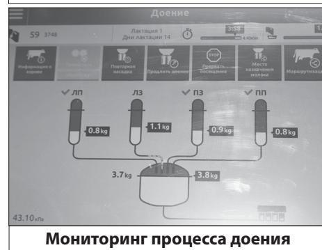
Мониторинг процесса доения

они получают сбалансированное питание. Специально для этого хозяйство заготовило 1500 тонн сенажа и 1300 тонн сена, также в рационе присутствуют и минеральные добавки в удобной для животных форме.