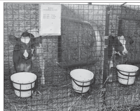
Родившиеся в хозяйстве телята

Для животных в хозяйстве созданы все необходимые условия. Поскольку айрширская порода не любит жару, то в зале установлен контроль климата, если температура поднимается выше 22 градусов, то автоматически включаются вентиляторы. Внутри загона установлены автоматические чесалки, которыми его рогатые обитательницы с удовольствием пользуются. При необходимости любую из коров можно зафиксировать возле кормового стола всего одним движением рычага, это позволяет оперативно оказывать помощь животному или проводить его проверку. Потолок над кормовым столом прозрачный, так что бурёнки постоянно имеют доступ к естественному освещению, круглый год