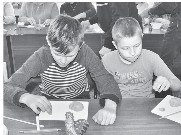
Турковские школьники пытаются сами вылепить игрушку