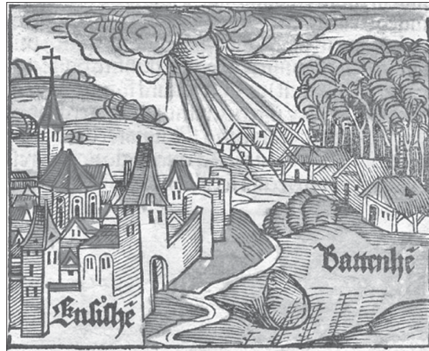
Дюрер. Энсисгеймский метеорит

Изучение метеоритов – это, собственно, и есть попытка понять, из чего сделан космос, из каких химических