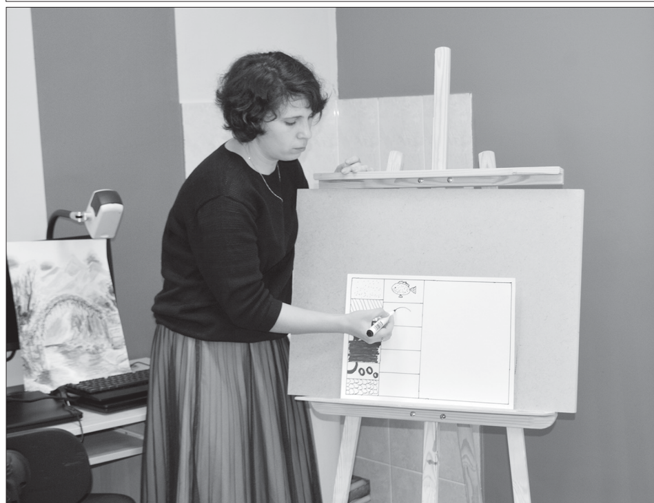
Рисунок рождается из точек, пятен и линий

инструментах (ложки, треугольники, трещотки), разучивание танцевальных движений, хороводы – всё это было очень интересно, поэтому все педагоги приняли активное участие в турнире.