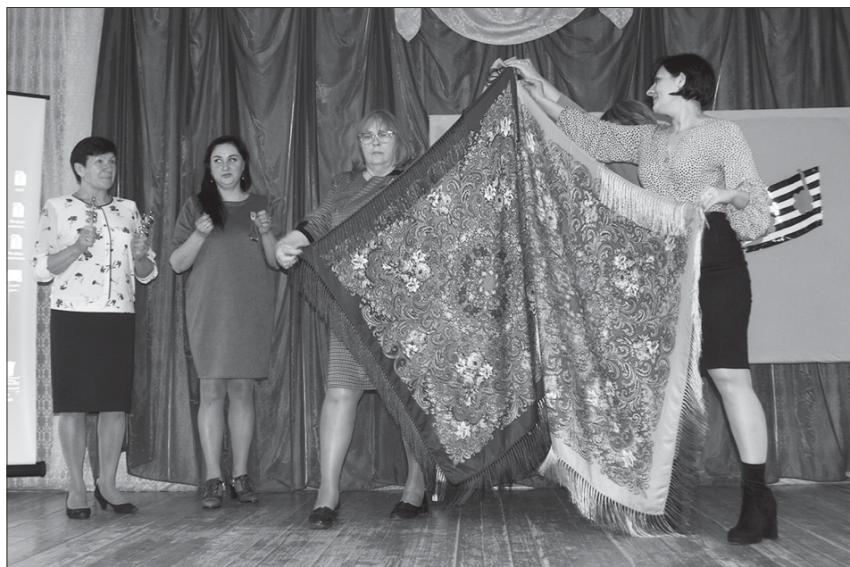
Ложки, трещотки и расписные платки - танцуют все

Традиционно в первой половине весны, сразу после научно-практической конференции школьников, в Турковском районе проходит методическая конференция для педагогов, участвуя в которой они демонстрируют своё педагогическое мастерство, рассказывают о тех методах, которые используют в работе, обсуждают проблемы, с которыми сталкиваются. В пятницу, 5 апреля, муниципальная методическая конференция «Слагаемые профессиональной компетентности педагога» состоялась на базе основной общеобразовательной школы р.п. Турки. В ней приняли участие девять педагогов, представлявших общеобразовательные школы, Дом детского творчества, Детскую школу искусств и детские сады.