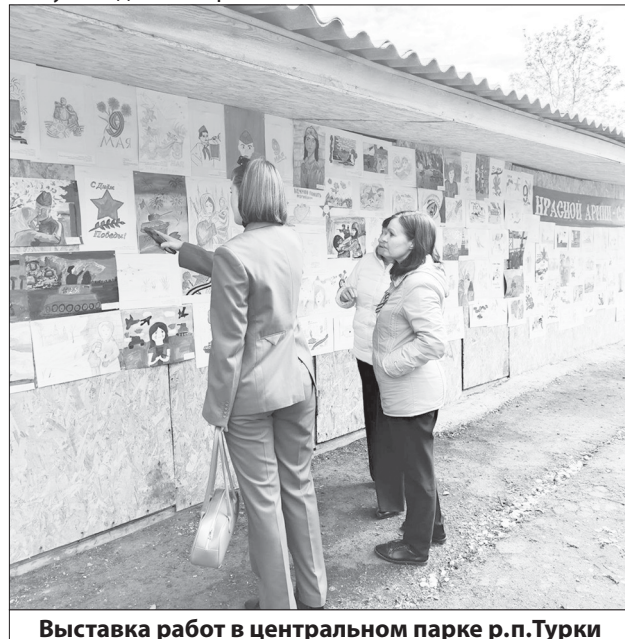
Выставка работ в центральном парке р.п.Турки