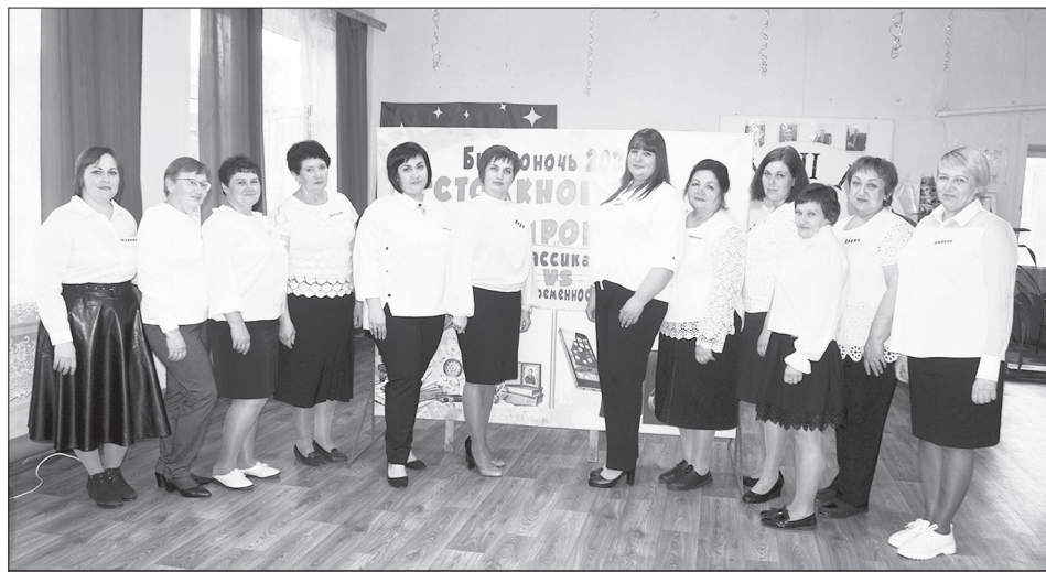
Коллектив Турковской межпоселенческой центральной библиотеки

27 мая в России отмечается Общероссийский день библиотек – профессиональный праздник людей, посвятивших себя благородному делу сохранения и приумножения культурного наследия, распространению знаний и просвещению. В Турковском районе эта дата имеет особое значение, ведь наши библиотеки – это не просто хранилища книг, а настоящие центры притяжения для всех, кто любит читать и стремится к новым знаниям.