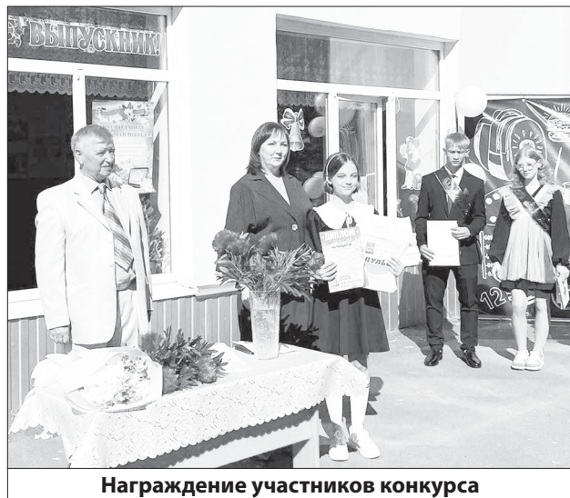
Награждение участников конкурса

Более 120 детей приняли участие в конкурсе рисунков, организованном редакцией газеты «Пульт»