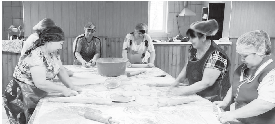
Волонтеры готовят лапшу для наших бойцов

В отдаленном селе нашего района Лунино живет дружная команда волонтеров, которые своим трудом и заботой согревает сердца наших солдат, находящихся в зоне специальной военной операции. За чашкой вкусного, ароматного чая, в по-домашнему уютной обстановке они поделились своей историей помощи нашим защитникам.