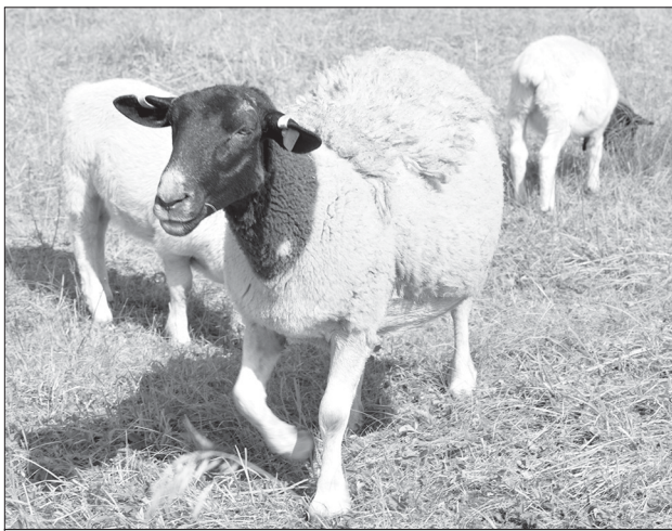
Дорперы на выпасе

Из-за специфики работы с овцами многие операции на ферме выполняются вручную. Из повседневных работ