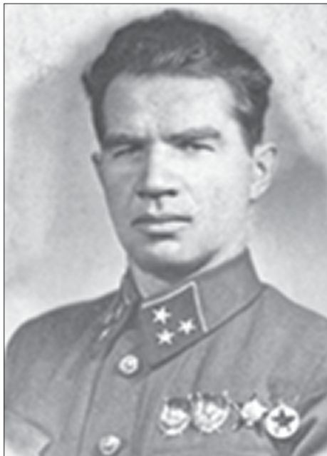
Василий Иванович Чуйков

Второе февраля – дата, напоминающая нам о величайшем подвиге нашего народа в Великой Отечественной войне. В этот день победой Красной армии завершилась Сталинградская битва – главное сражение XX века, 80-летие Победы которого мы отмечаем в этом году. И сегодня вспомним о тех двухстах днях, переломивших ход великой войны.