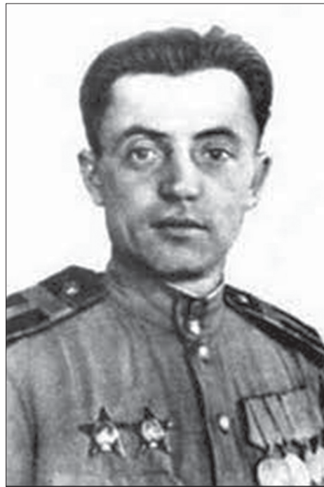
Яков Федотович Павлов

Сержант Яков Павлов, легендарный красноармеец, вместе с тремя бойцами выбил противника из четырехэтажного дома в центре города. На два месяца руины стали неприступной крепостью. Дом Павлова стал одним из символов Сталинградской победы. Небольшая группа бойцов, которой командовал Павлов, обороняя один дом, уничтожила вражеских