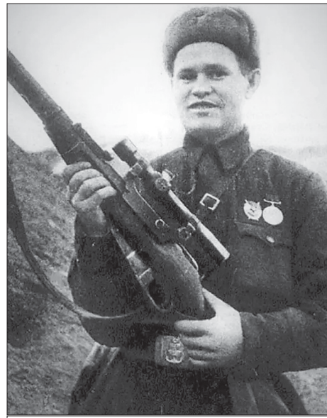
Василий Григорьевич Зайцев

суждался план стратегической операции «Кольцо», целью которой было уничтожение окруженной группировки вермахта. Девятого января немцам был предъявлен ультиматум с предложениями о прекращении сопротивления «в условиях сложившейся безвыходной обстановки, во избежание напрасного кровопролития». Наша попытка проявить гуманность к попавшему в критическое положение противнику не увенчалась успехом. Грубо нарушая международные правила, гитлеровцы открыли огонь по парламентарам. Нашему командованию оставалось одно – применить силу.