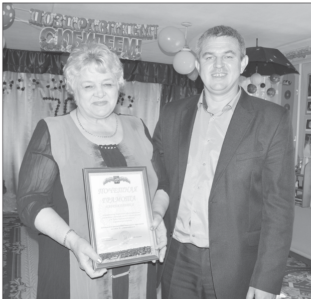
На 70-летию «Колокольчика»