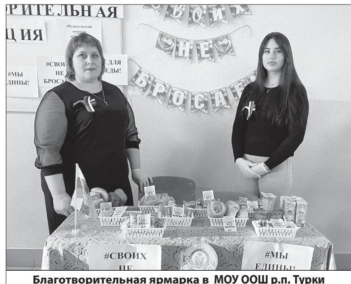
Благотворительная ярмарка в МОУ ООШ р.п. Турки