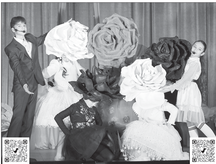
На сцене номер «Дети цветы жизни»

Сцена наполнилась юной энергией и безграничной любовью, которую дарили зрителям исполнители. Перед публикой предстали как яркие солисты, так и слаженные детские вокальные и хореографические коллективы районного Дома культуры и Школы искусств. Каждый из детей, выходящих на сцену, вложил в свое выступление частичку души.