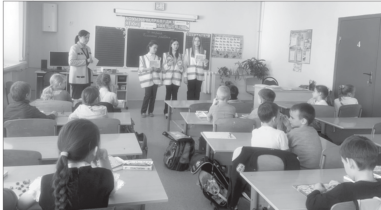
Отряд ЮИД МОУ ООШ р.п. Турки напомнил первоклассникам Правила безопасности езды на велосипеде

Велосипедисты должны ехать по проезжей части как можно ближе к обочине. Старайтесь двигаться по тротуарам и пешеходным дорожкам, но делайте это с максимальной осторожностью – это территория пешеходов.