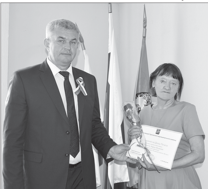
Вручение свидетельства о занесении на Доску почёта

В современном мире, где ритм жизни постоянно нарастает, встречаются люди, для которых работа становится не только способом получения денег, их жизнь это их работа. Причины этому разные: желание построить карьеру и заработать деньги, интерес к делу, возможность уйти от одиночества. Человек, который выбрал работу основной жизни, живет работой, отдает ей всего себя. Наша героиня – одна из этих людей.