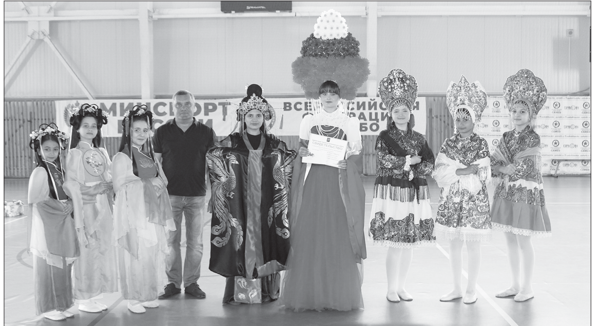
Награждение коллектива кружка театра моды «Эйфория» МУК «ТРДК»

После награждения коллектив кружка театра моды «Эйфория» и коллектив детского ансамбля ложарей «Сувенир» показали свое мастерство,